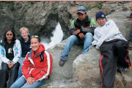
Une introduction des jeunes au parc national Monts-Torngat

« J'aimerais profiter de cette occasion pour exprimer mon appui à l'approche adoptée par l'Agence Parcs Canada dans la création d'un comité entièrement inuit. Il s'agit d'une décision porteuse d'avenir qui montre les grands progrès de la relation entre l'Agence et les Inuits de la région. »