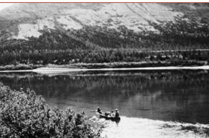
Rivière Koroc (1951)

« Les aires protégées font partie de réseaux écologiques, culturels et économiques plus vastes; elles sont inextricablement liées aux paysages régionaux dont elles font partie, et les éléments de ces liens sont dynamiques et non statiques. »