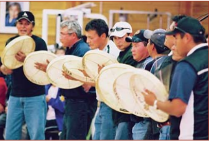
Drummer de Déline à l'Assemblée national de Dénés

La nécessité d'assurer le bien-être général des collectivités est reconnue tout au long du processus menant à la détermination des zones protégées.