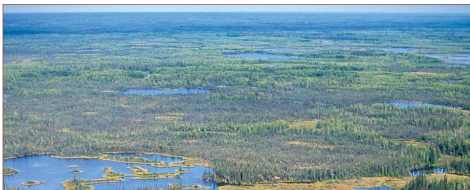
Zones humides dans la zone d'étude Ts'ude niline Tu'eyeta (à l'ouest de Fort Good Hope)

Une fois établie, chaque zone devra continuer à être gérée et surveillée en complète coopération avec les populations locales.