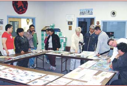
Le Comité consultatif de la communauté de Coral Harbour

De plus en plus souvent, les collectivités proposent des zones pour l'établissement potentiel de parcs en s'appuyant sur leurs propres connaissances et avec le désir de protéger des lieux qui sont importants à leurs yeux.