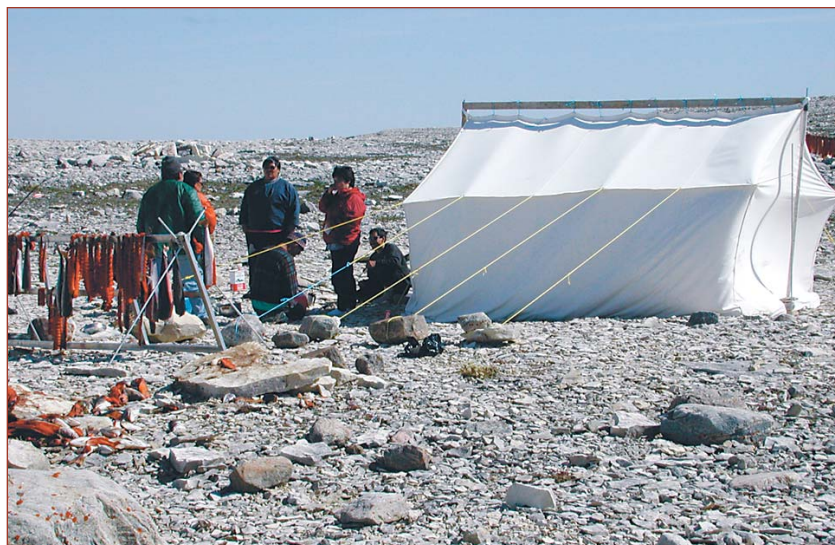
Camp de la zone à l'étude pour le parc Alijivik

La participation des collectivités et des résidents Inuits à la définition de tout le programme et à la détermination des mesures de gestion et des approches en la matière pour leurs parcs, engendre un sentiment d'appartenance et fait que les initiatives de conservation s'en trouvent davantage soutenues.