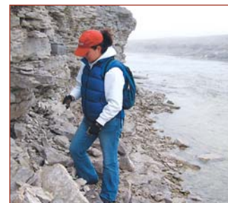
Le personnel du Service des parcs territoriaux et des lieux exceptionnels du Nunavut en train d'explorer « Fossil Creek » à Coral Harbour, au Nunavut