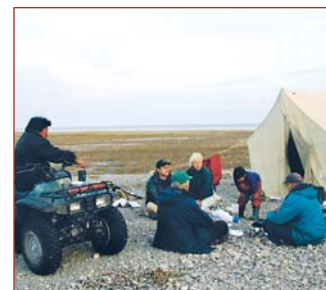
Le Comité consultatif de la communauté de Coral Harbour sur la zone à l'étude pour le parc proposé Alijivik, droit d'auteur Service des parcs territoriaux et des lieux exceptionnels du Nunavut